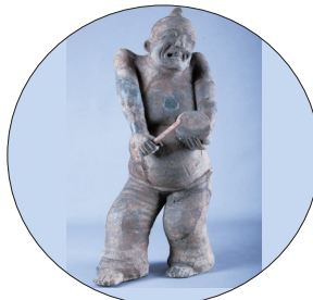
东汉陶说唱俑