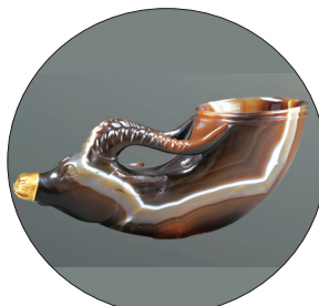
镶金兽首玛瑙杯