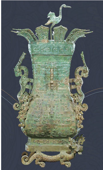
莲鹤方壶

许多青铜器铸造时会在器身刻写大篇幅铭文,记述作器者事迹、作器缘由,成为研究当时历史宝贵的一手史料。鼎作为古代中国王权的重要象征,青铜礼器作为“周礼”的物质遗产,在历史更迭的叙事中无数次站在舞台中央。