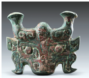
陕西清涧寨沟遗址后刘家塔墓地出土的铜车马器。