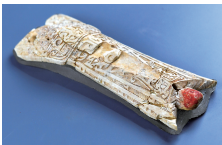
陕西清涧瓦窑沟墓地出土的雕花象牙器。

此外,多学科研究揭示了社会生活的细节。对人骨的分析显示,贵族饮食中动物蛋白摄入显著高于平民,反映了社会阶层分化;而人群普遍患有较高比例的骨膜炎,则可能与他们长期在沟壑间劳作行走有关,是黄土高原生活方式的真实写照。