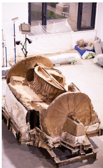
陕西清涧瓦窑沟墓地M3号墓出土的双辕车。