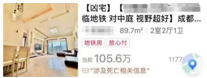
▼ “凶宅”去年的拍卖情况。