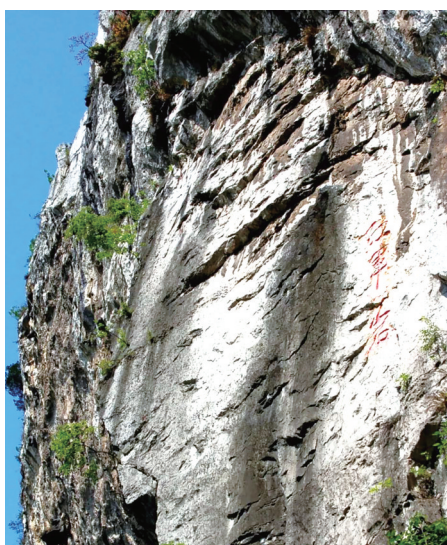
红军岩 图据兴文县融媒体中心