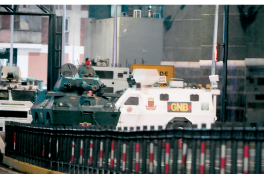
1月3日凌晨在委内瑞拉首都加拉加斯的总统府附近拍摄的军用车辆。