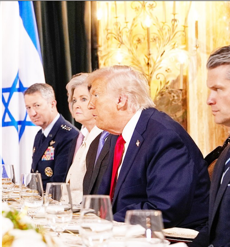
▲ 12月29日下午,美国总统特朗普在佛罗里达州海湖庄园会晤到访的以色列总理内塔尼亚胡。

另据伊朗伊斯兰共和国通讯社本月21日报道,伊朗武装部队副总参谋长艾哈迈德·瓦希迪就以色列方面近期威胁言论表示,这是以色列“动荡和软弱