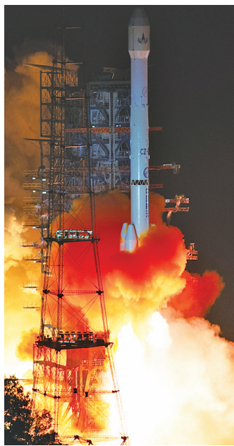
12月27日0时07分,我国在西昌卫星发射中心使用长征三号乙运载火箭,成功将风云四号03星发射升空。