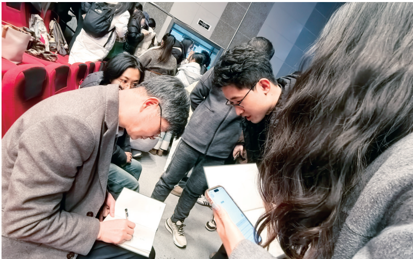
现场学生请赵平安教授签名。

赵桐锐说，赵平安教授的讲座内容里不仅仅是笔画的繁简与变异，还有奔放自由的文化气息。“特别是赵教授分析到的那个‘京’字与各地地理方位的关联，在多重文献中的记载与演变，让我印象深刻。赵教授严谨的治学态度也深深启发了我，去探寻文字背后更深层的文化逻辑。”