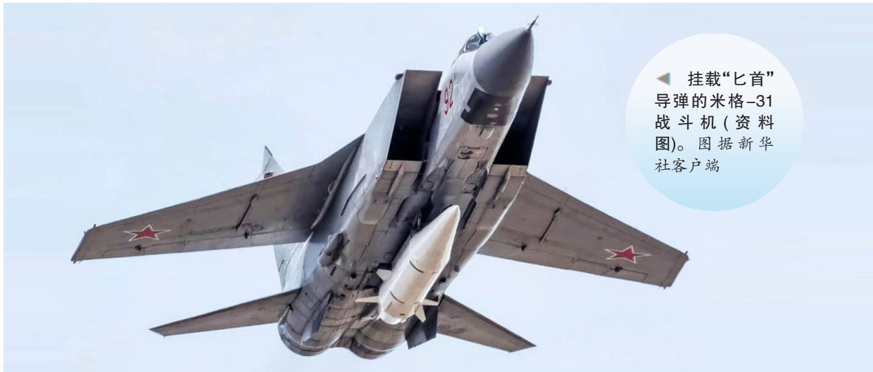
▲ 挂载“匕首”导弹的米格-31战斗机(资料图)。