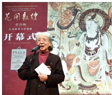
常沙娜在“花开敦煌——常沙娜艺术研究与应用展”开幕式上致辞。

94载岁月流转,常沙娜的面庞上始终漾着少女般的笑意。她是人们眼中“永远的敦煌少女”,她是敦煌保护事业开拓者常书鸿的女儿,她12岁起便在莫高窟练习“童子功”。