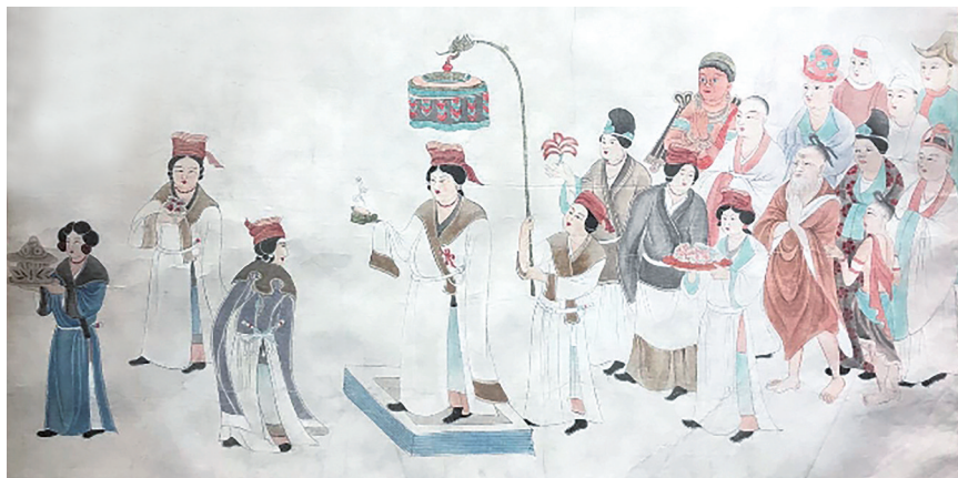
常沙娜16岁时临摹的敦煌壁画《吐蕃赞礼佛图》。