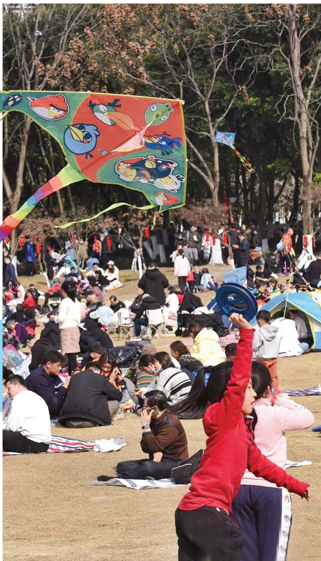
2022年2月13日，成都塔子山公园的小山坡上坐满了晒太阳的人。