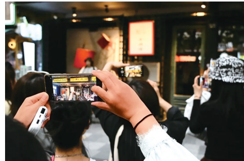
成都玉林西路的小酒馆成热门打卡地。

是啊，如果说摇滚的精神是自由，那这样自由地做自己喜欢的音乐，不就是最“摇滚”的么？据说，现在成都跳广场舞的配乐都是马赛克乐队的歌曲，真是让人想“老也入川”。