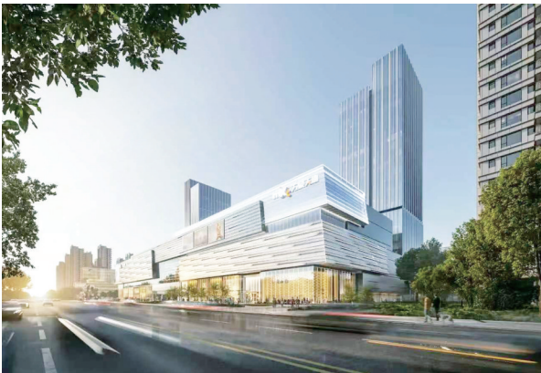
成都首座万象天地效果图。