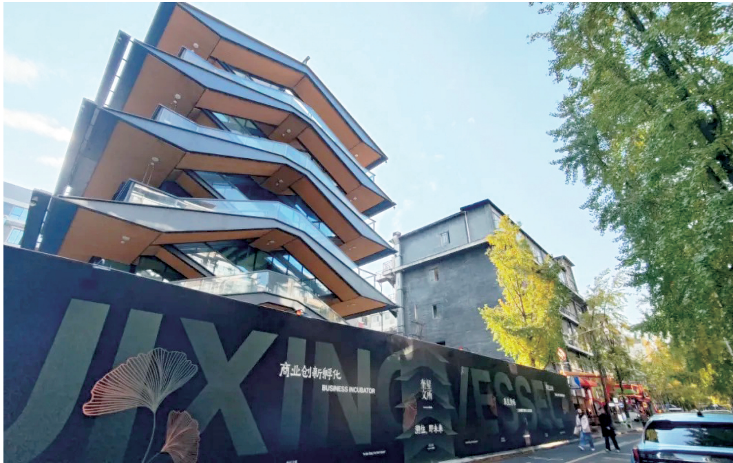
成都热门打卡地奎星楼街新地标——奎星文所效果图。

成都新津经开区同样迎来产业新动能。近日,成都弘域智谷产业园一期正式开工,项目聚焦高端智能装备与医疗器械,建成“满园”后可容纳50余家优质企业入驻,年总产值预计将突破10亿元。项目规划建设14栋生