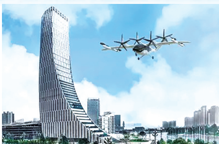
成都高新区已聚集一批低空经济企业,并形成了一批应用场景。

这抹“活力橙”,藏于生产线一个个“隐形冠军”中。国内首台完全自主知识产权的F级50兆瓦重型燃气轮机开启工程应用,首款TROP2国产抗体偶联药物获批上市,国内首台有望“秒杀”癌细胞的e-Flash放疗设备进入临床试验……这些“四川造”新产品,正切实改变我们的生活。当科技创新和产业深度融合,“1+N”中试研发平台体系中的410家中试平台,