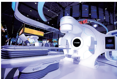
长虹中玖闪光FLASH放疗设备。