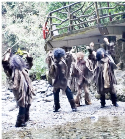
巴山大峡谷景区“野人”NPC和游客互动。

工作人员表示，这份“野人”岗位的核心要求是“够野、够放得开”，无年龄、性别等条件限制。岗位职责规定：除特殊待遇外，例如游客求助等事项外，全程不可说人话，仅能以“嗷嗷叫”交流；要会烧洋芋、烧苞谷、烧红苕等，能主动和游客进行趣味互动。上岗前，景区会进行简单培训，内容包括互动方式、工作内容等基础事宜。