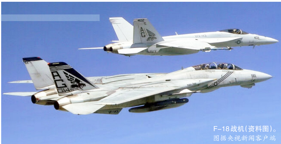
F-18 战机(资料图)。

一名不愿公开姓名的美国国防部官员对美联社记者说,两架战机当天执行了“例行训练飞行”。这名官员没有透露战机是否携带武器,称飞