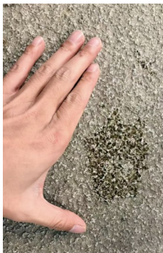
12月5日,在发现欧亚水獭的岸边,水獭上岸后在步道上留下的足迹。