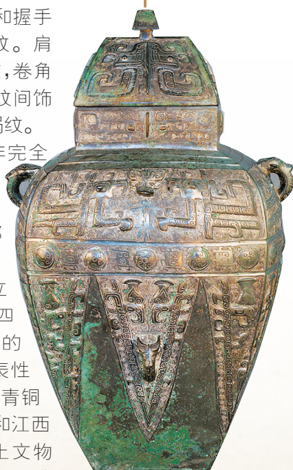
商兽面纹铜罍