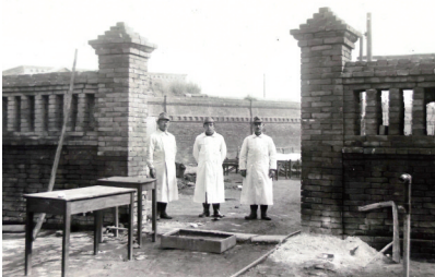
日军“花见部队”相册内的照片。