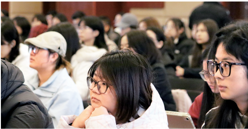
现场观众认真聆听讲座。

中华优秀传统文化工作协调组主办，四川日报报业集团（封面新闻、华西都市报）承办。讲座致力于打造面向大众、深入人心的知识讲坛，力争成为中华优秀传统文化普及传承的品牌活动，并努力探索构建符合当前时代需求的中华优秀传统文化传承体系。自举办首期讲座以来，名人大讲堂已成功举办了74场，先后邀请李敬泽、阿来、郗薇、祝勇、莫砺锋、周裕锴等全国多学科专家，围绕20位四川历史名人及巴蜀特色文化开讲，探寻古蜀文化遗珍，实证中华文明多元一体，深入解读中华文化巴蜀因子的独特魅力，全网累计逾1亿人次观看直播。