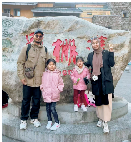
外国游客打卡四川冰雪景区毕棚沟。