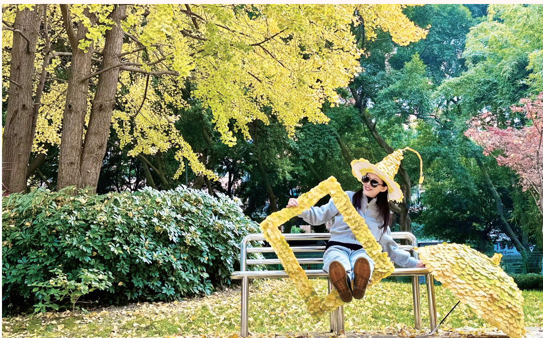
成都市民在银杏树下凹造型。