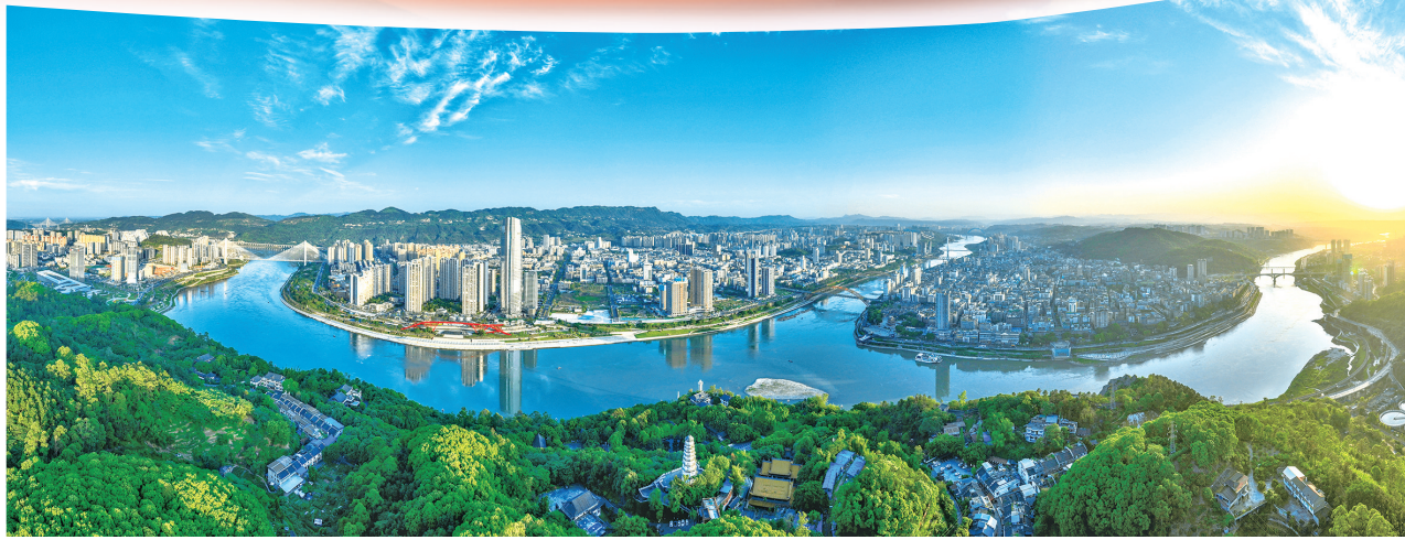
▲ 远眺宜宾城。