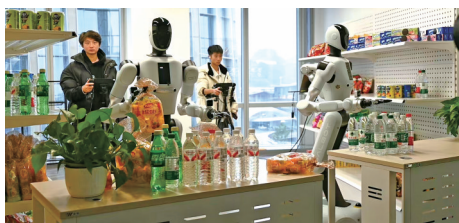
▲ 位于宜宾的具身智能机器人异构训练中心。伍雪梅 摄