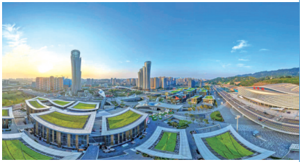
▲ 万象宜宾天地。