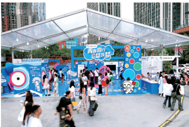
▲ 四川体彩品牌落地活动。