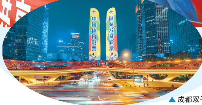
▲ 成都双子塔体彩宣传。

9月,随着2025/2026四川省城市足球联赛(川超)的揭幕,四川人迎来了自己的足球盛宴。四川体彩作为川超官方赛事支持单位,以公益初心为笔、以饱满热情为墨,超87万观赛球迷近距离领略到四川体彩的公益形象,生动诠释了“公益体彩 乐善人生”的品牌理念。