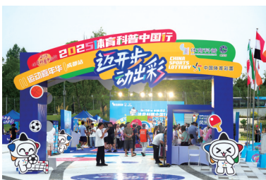
▲ 四川体彩品牌落地活动。