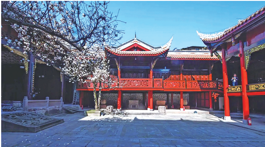
春秋祠 图据叙永融媒

这些精美的清代木雕,为春秋祠赢得了“川南木雕博物馆”的美誉。其中,“永宁八景”木刻画匾、八扇木刻“百鸟梅花窗”,以及透雕石刻香炉、石墩、花几等,尤为著名,代表了晚清时期中国木雕石刻技艺的巅峰水准。著名美学家王朝闻先生游览春秋祠之后,在《蜀游三记》中称之为“川南瑰宝,木雕