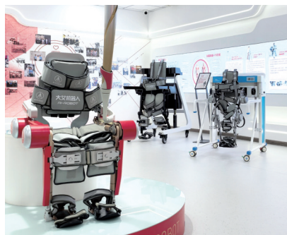
“大艾”外骨骼机器人。

疗器械产业蓬勃发展的缩影。据泸州市医药健康产业发展局总经济师曾成俊介绍,目前,泸州正紧扣省委赋予的“建设区域医药健康中心”使命任务,按照“事业产业双轮驱动、一核一极协同