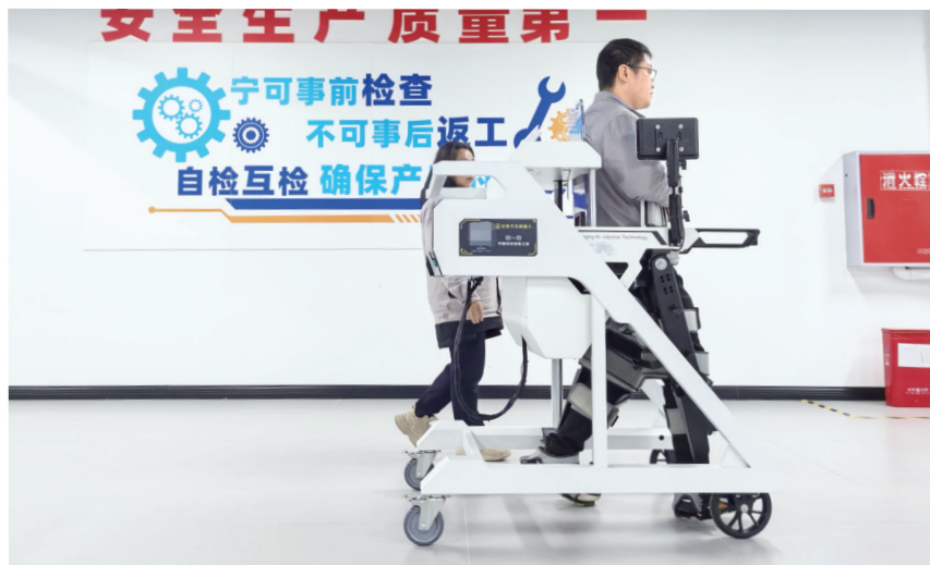
工厂内,工人正在对外骨骼机器人进行测评、调试。