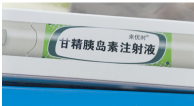
滞留前台的药品之一。