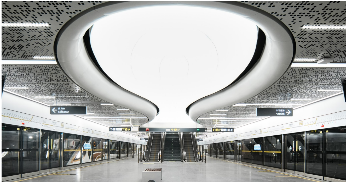
成都地铁13号线一期杜甫草堂站

11月19日，贯穿成都中心城区的轨道交通新干线——成都轨道交通13号线一期工程车站正式揭开面纱。