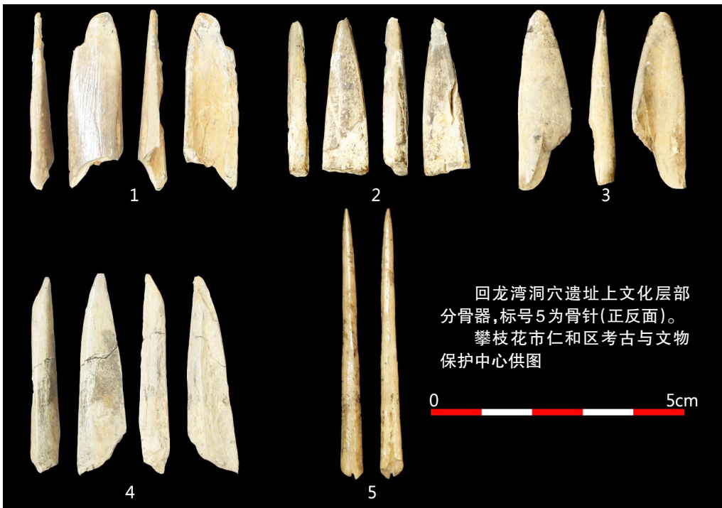
回龙湾洞穴遗址上文化层部分骨器，标号5为骨针（正反面）。