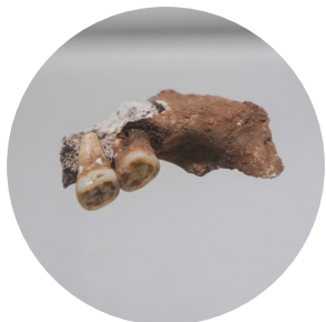
回龙湾洞穴遗址中发现的智人牙齿。

很少有人知道，这里是四川目前发现最早的旧石器时代洞穴遗址，也是唯一有着丰富遗存的洞穴遗址。说攀枝花历史短？骨针实证：攀枝花这座建市60年的“移民城市”，其“年龄”至少有一万五千年，堪称“老辈子”！