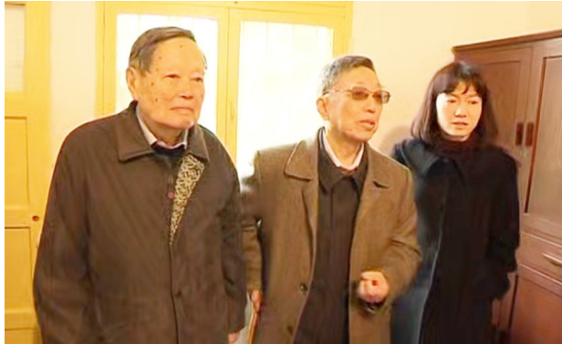
2017年3月24日,95岁的杨振宁(左一)携夫人翁帆参观绵阳梓潼两弹城。

“杨爷爷的逝世,让我们失去了一个学术引路人。”西南石油大学人工智能专业二年级学生周梓琳回忆,杨振宁教授2017年3月来到绵阳时,她还是绵阳实验小学五年级的学生。“我们在邓稼先