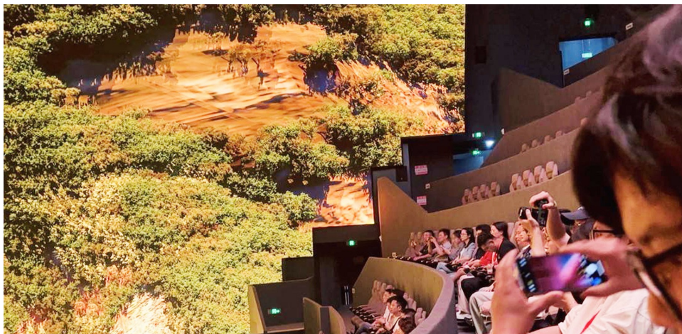
大V们在16K沉浸式超高清球幕飞翔影院现场体验。

与此同时，封面新闻同步推出专题，吸引全网用户“云游”互动。从智能工厂的工业交响到千年古镇的光影诗画，再到全国最大16K球幕飞翔影院的视觉奇观，一场关于红色基因与数字经济的深度对话，正在秦巴山麓徐徐展开。