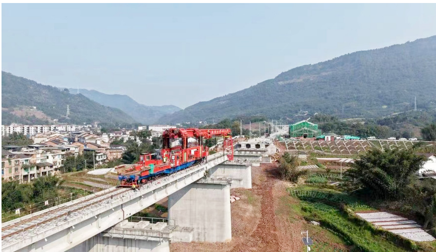
兴隆乡大桥铺架现场(二号架桥机)。

项目由蜀道铁路投资集团主导投资建设,全长138.6公里,其中既有线29.2公里,新建线路109.4公里,共需架设T梁836孔,计划今年7月完成全线T梁架设工作。隆黄铁路隆叙段扩改项目架梁条