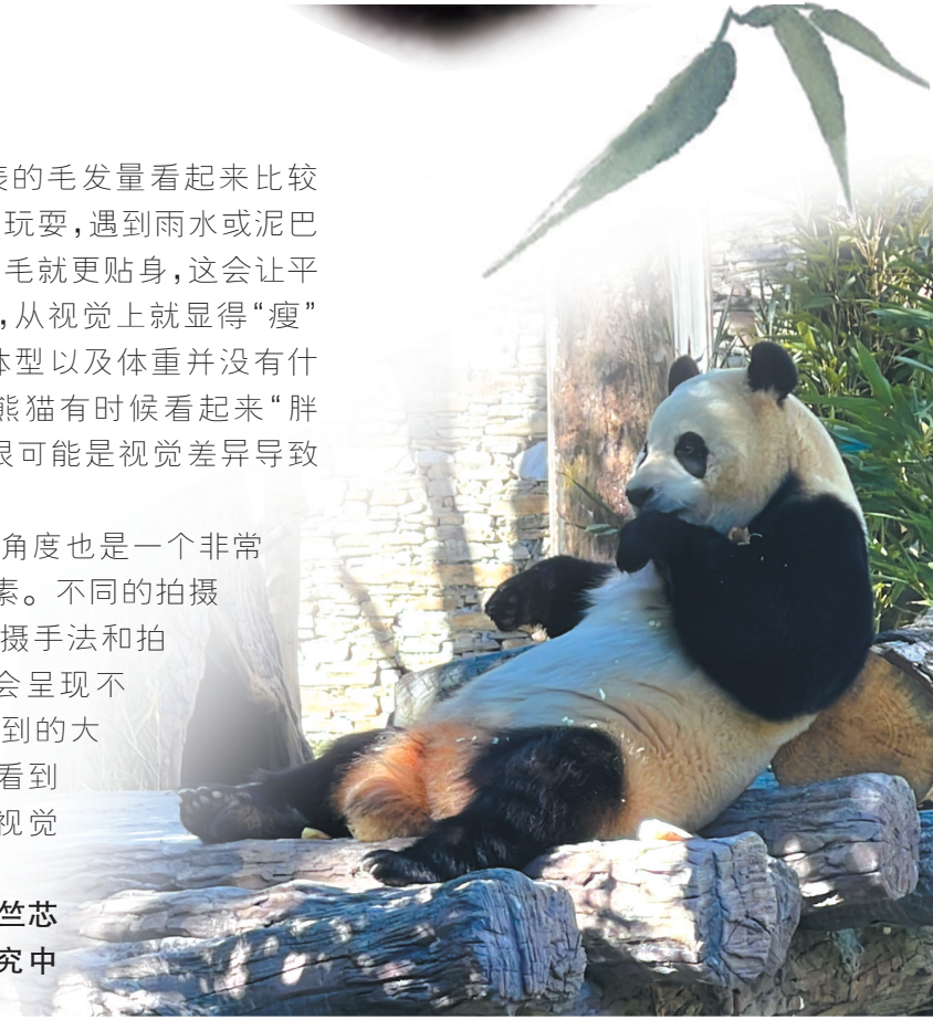
吃竹笋的“福宝”萌态十足。