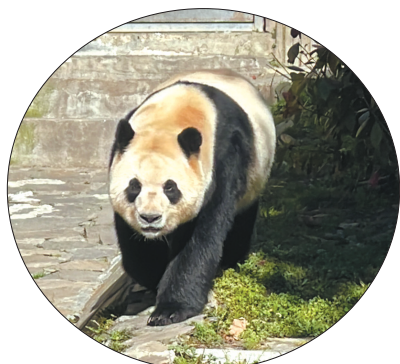
3月25日，大熊猫“福宝”在中国大熊猫保护研究中心卧龙神树坪基地复展。