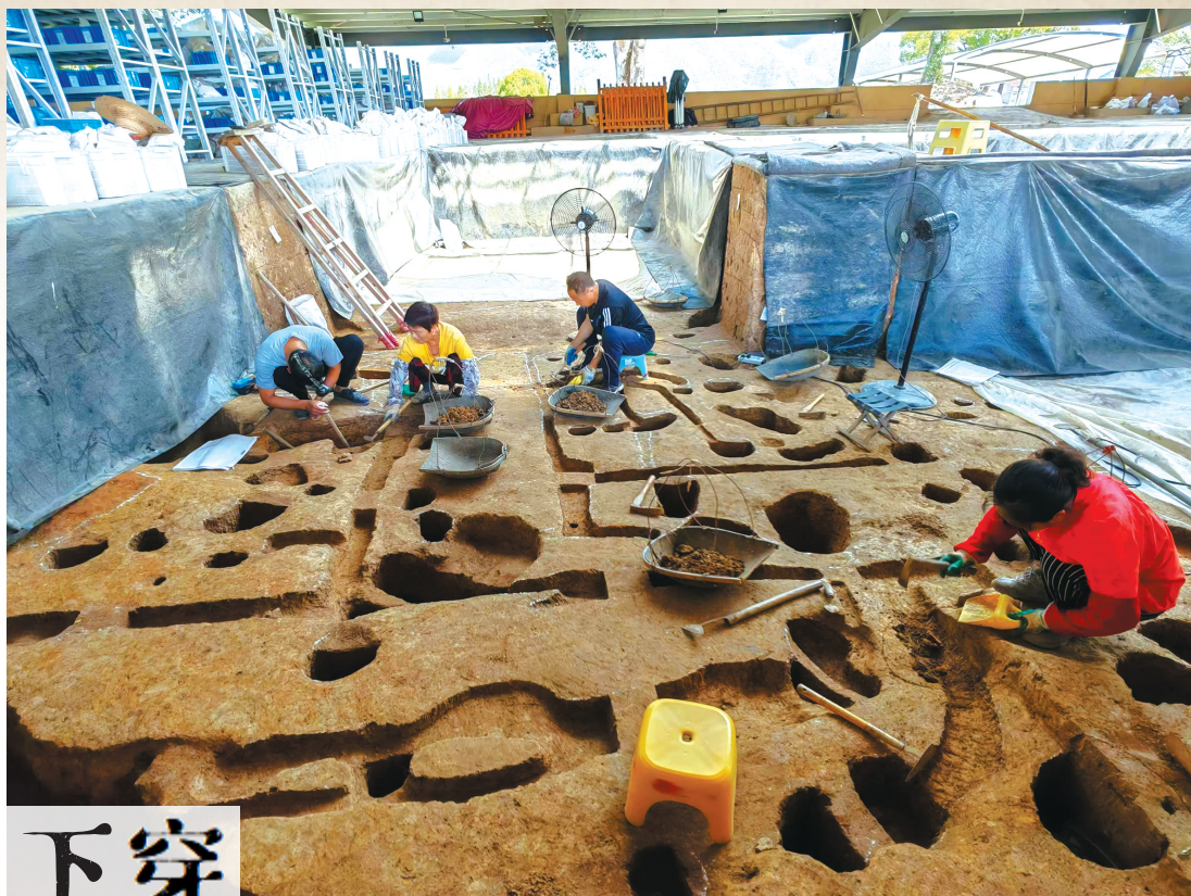
下汤遗址发掘现场。