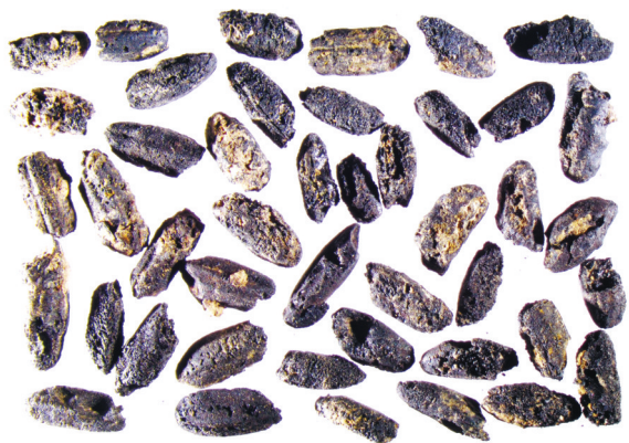
下汤遗址出土的碳化稻米。

那时，这里已有村落，先人们种稻、建房、烧陶。如今，我们来到这一遗址，感受新石器时代的人间烟火，感悟中华文明的生生不息。