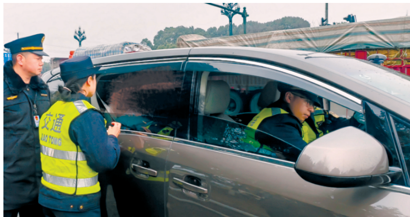
执法现场。

执法人员当场分别对驾驶员及车上6名乘客进行询问，其中一名女乘客声称自己是导游，此行是陪同朋友游玩，并出示了导游证件。敏锐的执法人员在询问中发现，其他乘客与女子并不