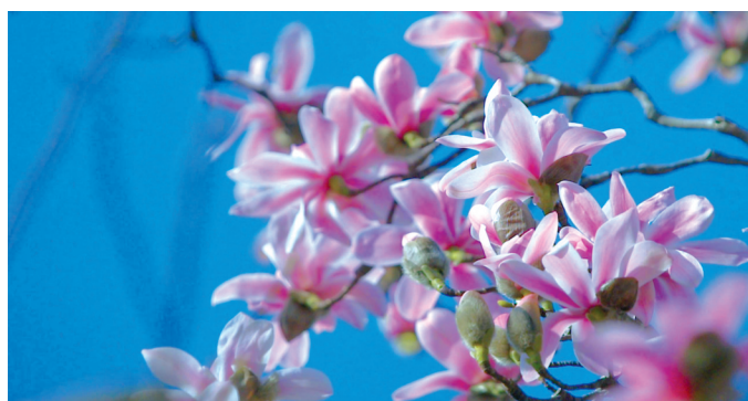
古旱莲的花瓣宛如精美的丝绸。

旱莲的生长特性极为独特。花开之时,满树繁花似锦,却不见一片绿叶,馥郁的香气丝丝缕缕弥漫在空气中,沁人心脾。其花朵形态酷似水中莲花,正因如此,它被赋予了“旱地莲花”的美誉。