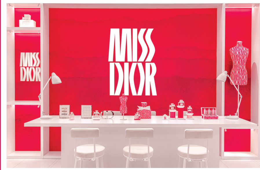
迪奥小姐爱意工坊限时店。路易威登 x 村上隆限时空间亮相上海巨鹿路。

限时店融合香氛艺术、互动装置与定制妆容体验，将品牌经典元素转化为可感知、可参与的场景。这种“体验式营销”打破了传统奢侈品的高冷形象，通过限时属性吸引年轻消费者打卡分享。循香步入限时店，迪奥小姐香水高订瓶身跃然眼前，尽显女性力量与优雅之姿。“迪奥小姐画廊”里帧影交错，宾客可在此沉浸式聆听品牌与迪奥小姐的历史故事；移步至“迪奥小姐闻香室”，迪奥小姐三款经典香水之作以隽永西普香调演绎法式香韵的曼妙芬芳；漫步“迪奥小姐典藏臻品长廊”，迪奥小姐香氛的限量臻作尽释迪奥高订工坊的诗灵感；走进“迪奥小姐爱意工坊”，迪奥小姐定制产品陈列其中，难掩高订风貌与非凡光彩；邂逅迪奥小姐定制妆容，以缤纷繁花的缱绻芬芳为灵感，洋溢花漾灵动的女性风采；另有巧心布置的“迪奥小姐花店”，如同浸入花漾幻梦，尽享迪奥小姐繁馥隽永的青春絮语。