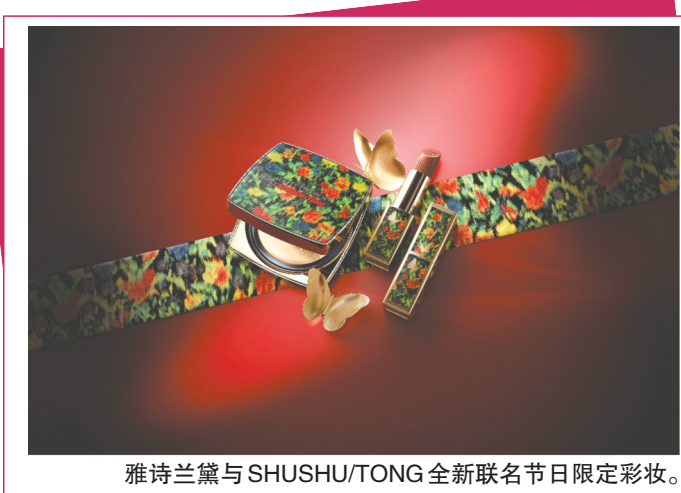
雅诗兰黛与SHUSHU/TONG全新联名节日限定彩妆。

如今，依托技术进步和路易威登的精湛工艺，每件作品的印花效果得以升级焕新，其色泽更为明丽，村上隆设计的角色和图案也更加清晰精准。路易威登 x 村上隆合作系列的第一篇章旨在致敬路易威登和村上隆的划时代合作系列诞生20周年，在全新系列中，Monogram Multicolore 图案大放异彩，相互交织的LV字母和花卉图案呈现33种不同色调，呈现出前所未有的绚烂效果，并铺陈于多款经典手袋，以及腰带、钱夹、坡跟鞋、引人注目的Rolling Trunk硬箱等。值得一提的是，全新系列将以沉浸式视觉形式呈现，其中包括橱窗陈列、限时空间、店内装置、创意体验等。