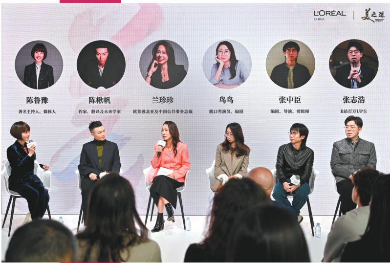
欧莱雅中国“美之道”文化论坛嘉宾分享。