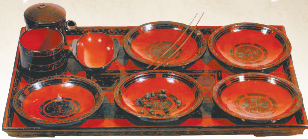
马王堆汉墓出土云纹漆案上的食具。