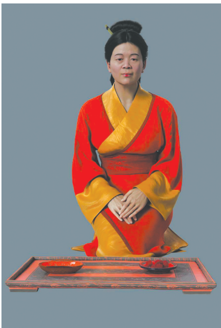
湖南博物院公开发布的“辛追夫人”3D数字人(35岁左右)形象。 新华社发(长沙数字鲸鱼科技有限公司制作)

其中,轪侯利苍的夫人——辛追夫人的1号墓保存最为完整,考古队员从中发现了2000多年前古代贵族衣食住行的秘密。