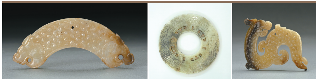
安徽淮南市武王墩战国晚期一号墓出土的玉器(资料照片)。