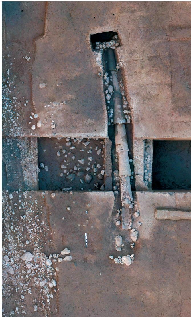
陕西宝鸡市周原遗址宫城西北角铺石道路及陶排水管道(资料照片)。

构与管理、人群组成和信仰、原料开采与加工运输、景德镇市内手工业分工与形态的变化、御窑和民窑的关系、市场需求对景德镇产品的影响等内容提