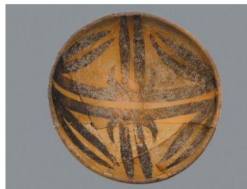
▶马尔康孔龙村遗址出土的彩陶钵。

2月19日，“2024年中国考古新发现”在北京揭晓，共有6个遗址项目入选，6个遗址项目入围，另有1个国外考古新发现项目。四川马尔康孔龙村遗址获评“2024年中国考古新发现”入围项目。