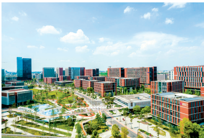
成都天府国际生物城。