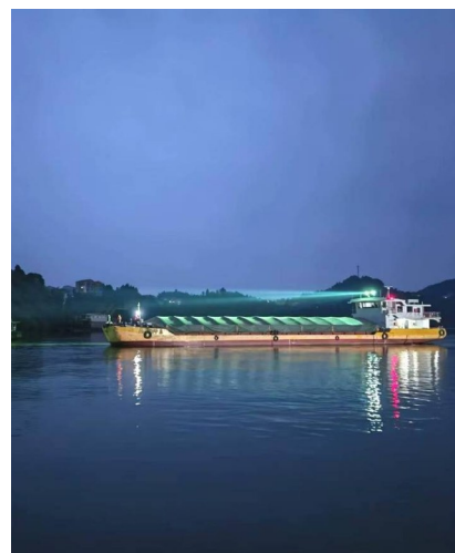
2025年1月1日,嘉陵江南充段夜航试航。

华西都市报(记者 曹菲)2月10日,记者从四川省交通运输厅获悉,近期,四川省交通运输厅、重庆市交通运输委员会联合印发经修订的《嘉陵江梯级通航建筑物联合调度规程》(以下简称《联合调度规程》),标志着川渝交通运输部门首次在全国先行先试建立的跨省级行政区域船舶过闸联合调度机制——嘉陵江全线梯级通航建筑物联合调度机制进一步健全完善,为服务成渝地区双城经济圈重大战略实施,共建长江上游航运中心贡献水运力量。《联合调度规程》将于3月1日起施行。