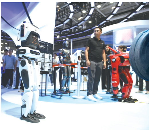
1月17日,在深圳举行的第二十六届中国国际高新技术成果交易会上,双足机器人在展示行走能力。