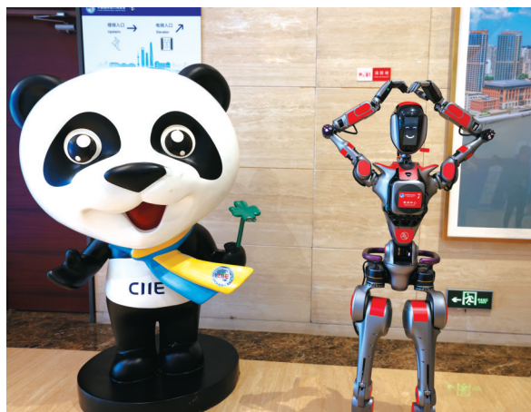
2024年11月4日,中国国际进口博览会吉祥物“进宝”和新闻中心的机器人“小新”(右)在欢迎记者。