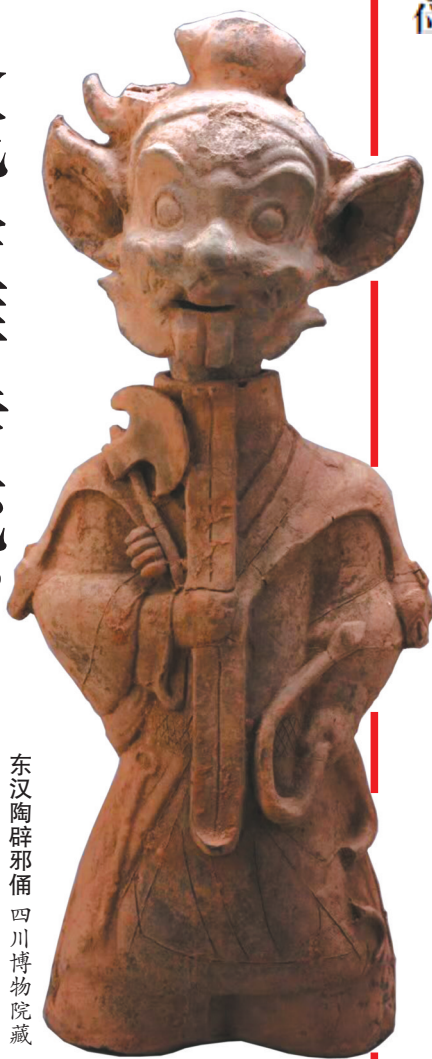
东汉陶辟邪俑 四川博物院藏

在人类与自然的互动中，蛇一直是令人畏惧的动物。在漫长的岁月更迭中，古代先民是如何生出关于蛇的崇拜、信仰的？博物馆中凝结了历史的文物，又如何呈现着古人与蛇的有趣互动？乙巳蛇年，快来开启一场“寻蛇记”，在文物中探寻蛇文化的奥秘。