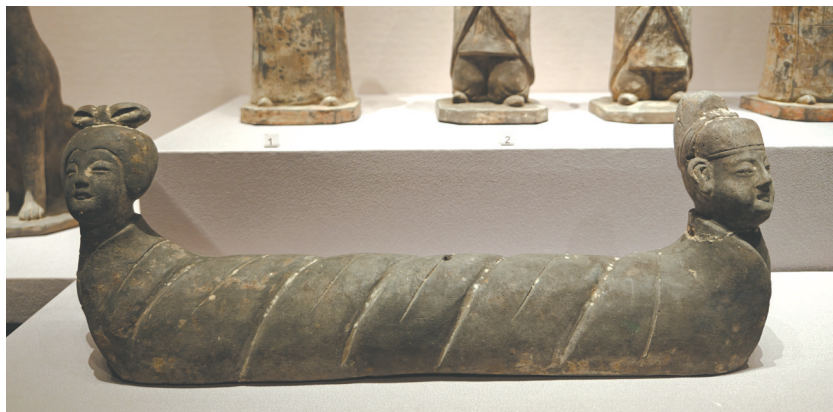
双人首蛇身俑。四川博物院藏