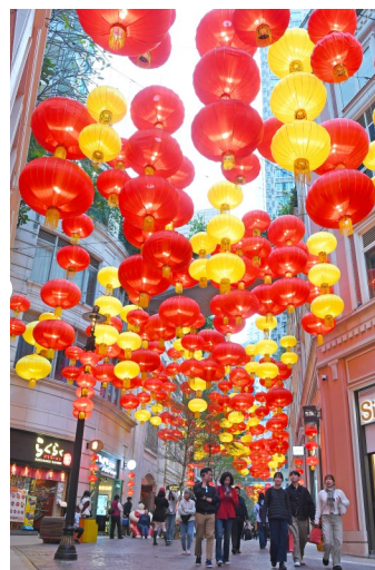
1月20日,人们在香港利东街逛街购物。