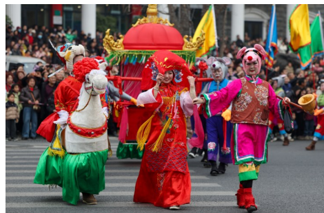
1月22日,在绵竹年画节开幕式上的巡游队伍。