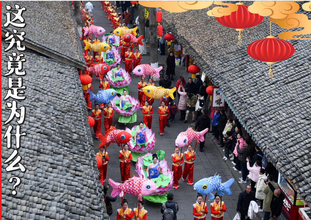
春节来临之际,阆中市非遗民俗表演队伍在古城街道巡游。