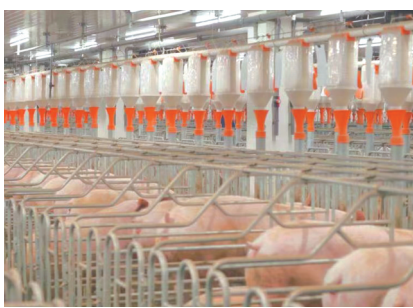
新希望集团养猪工厂