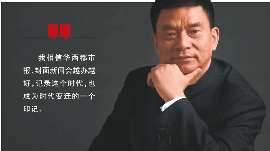
新希望集团董事长刘永好

刘永好说，成都是新希望起家的地方，也是集团总部所在地。一直以来，新希望都把成都、把四川当作根据地，不断深耕厚植，一起成长发展。新希望集团在四川坚持以农牧食品产业为主，同时在乳业与快消、化工投资、城市建设与生活服务、冷链物流、金融科技、医疗健康等多个领域布局，过去五年累计在川投资超500亿元，纳税超100亿元。