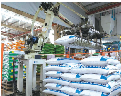
新希望集团饲料工厂

如今，新希望这家从成都走出去的企业，已经拥有全球第一的饲料产能，全国第二的冷链物流订单规模，全国第三的生猪养殖规模，全国第四的肉食品加工能力，销售额全国第五的液态奶乳业，还是中国最大的肉、蛋、奶综合供应商之一。