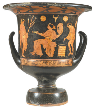
阿普利亚式红绘尊形调酒杯。

与美貌并存的雅典娜，象征光明、文艺、疗愈和预言的阿波罗；再到葡萄酒神狄俄尼索斯、大力神赫拉克勒斯……在本次展览中，观众将通过文物与熟悉的奥林匹斯诸神“相遇”，通过他们背后的故事与情感，了解古希腊人对生命、宇宙与人性的深刻理解和对美的追求，领略