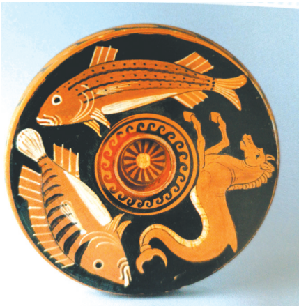
阿普利亚式红绘鱼盘。

与美貌并存的雅典娜，象征光明、文艺、疗愈和预言的阿波罗；再到葡萄酒神狄俄尼索斯、大力神赫拉克勒斯……在本次展览中，观众将通过文物与熟悉的奥林匹斯诸神“相遇”，通过他们背后的故事与情感，了解古希腊人对生命、宇宙与人性的深刻理解和对美的追求，领略