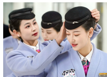
蓉港高铁乘务班组换新装。

即日起，华西都市报·封面新闻将同步推出2025年春运特别报道，从出行选择、购票方式、旅途服务等多个方面关注春运之变，陪伴大家走过新一年的春运旅途。华西都市报·封面新闻记者 曹菲