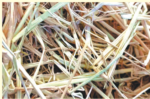
建昆虫屋的稻草材料。

其实,昆虫屋的设计理念源自对自然生态的深入洞察。昆虫屋采用空心竹、木屑、稻草等天然材料搭建而成,是为昆虫提供繁衍、栖息及越冬的场所。这些材料不仅对昆虫友好,而且能够随着时间的推移自然降解,回归自然循环。