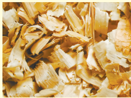
建昆虫屋的木屑材料。