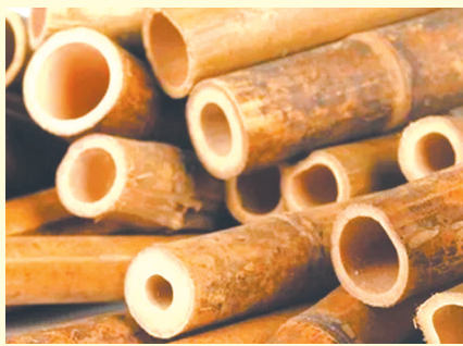
建昆虫屋的竹子材料。