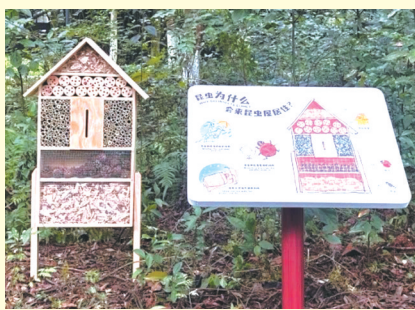
成都大熊猫繁育研究基地的昆虫屋

下次再到成都大熊猫繁育研究基地,别只顾着“追花”“望叶”,还可以多留心脚下、身边,说不定就能在某个角落,发现基地留给大家的小小“彩蛋”。