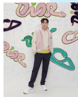
迪奥中国品牌大使刘宪华。

全新精品店与在二零二二年率先揭幕的太古里迪奥女装精品店相互辉映,共同构筑一座别具韵味的迪奥世界,不仅彰显迪奥对卓越美学的极致追求,完美诠释迪奥时装屋与法式生活艺术的精髓,更为成都这座时尚之都注入了蓬勃生机与非凡活力。