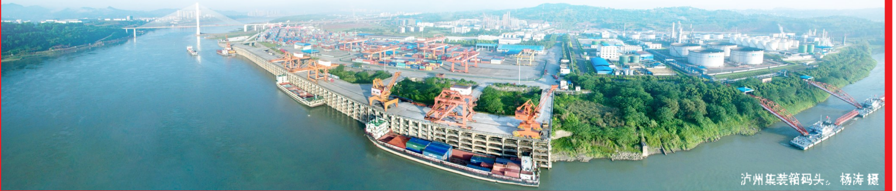
泸州集装箱码头。