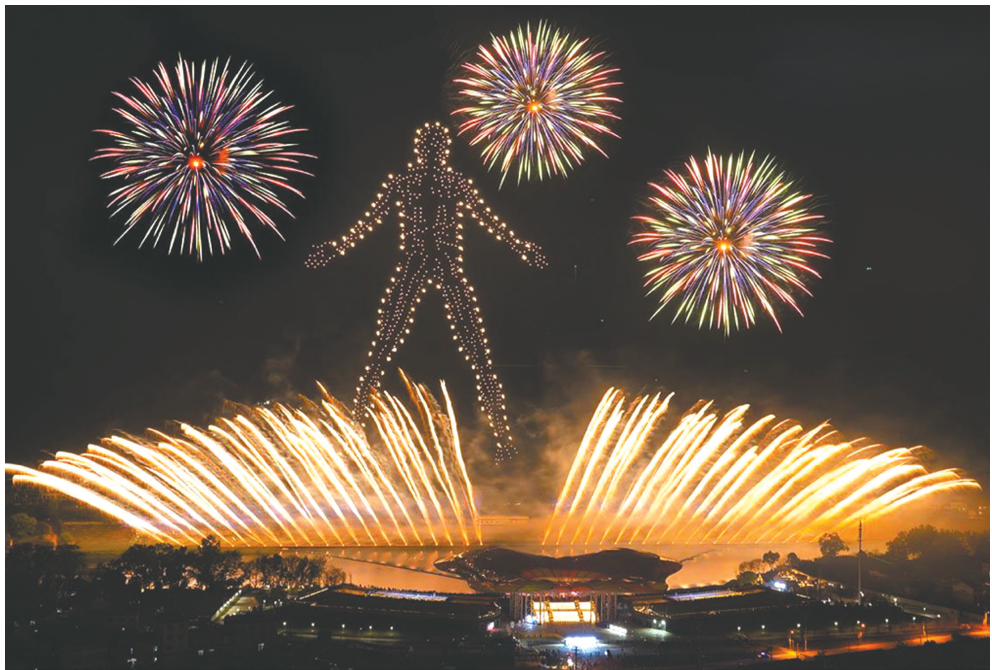
湖南花火剧团打造的烟花大秀。图据花火剧团官方网站